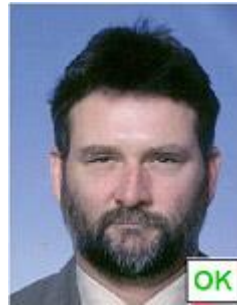
Posizione angolata da ritratto in studio