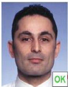
Inquadratura troppo ravvicinata